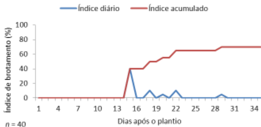
Figura 3: Índice de brotamento de estacas lenhosas de Tithonia diversifolia .