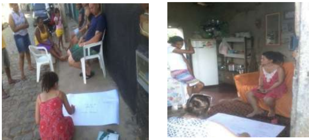
Figura 3: Entrevista através de uma dinâmica participativa com questionário semiestruturado, utilizando cartolina e caneta.

Na segunda visita aplicou-se a ferramenta Diagnóstico Rápido Participativo (DRP) (Figura 3) em que foi aplicado um questionário semiestruturado conforme preconiza Geilfus (2009).