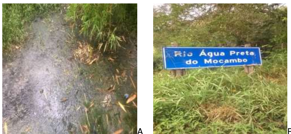
Figura 1: Primeira visita: conhecendo a comunidade e o trajeto do Rio Água Preta (A e B).

Na primeira visita realizada percorreu-se o trajeto do bairro São Miguel até a Rua Nossa Senhora da Conceição pertencente ao Bairro Irmã Dulce, observando-se todo entorno do Rio Água Preta e os problemas ambientais do mesmo.