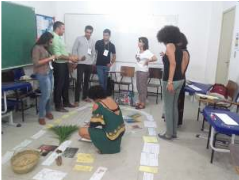
Figura 1: Construção da instalação pedagógica