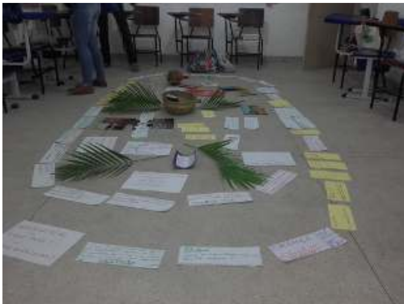
Figura 3: Instalação pedagógica finalizada.