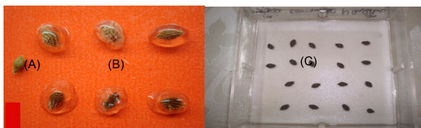
Figura 2. Sementes de J. spinosa com a sarcotesta seca (A), com mucilagem (B) e imediatamente após tratamento com Hidróxido de sódio (C).

Em adição às informações obtidas, as sementes tratadas com ácido muriático e sulfúrico apresentaram proliferação de fungos, enquanto as tratadas com NaOH e água estavam limpas desse tipo de contaminação.